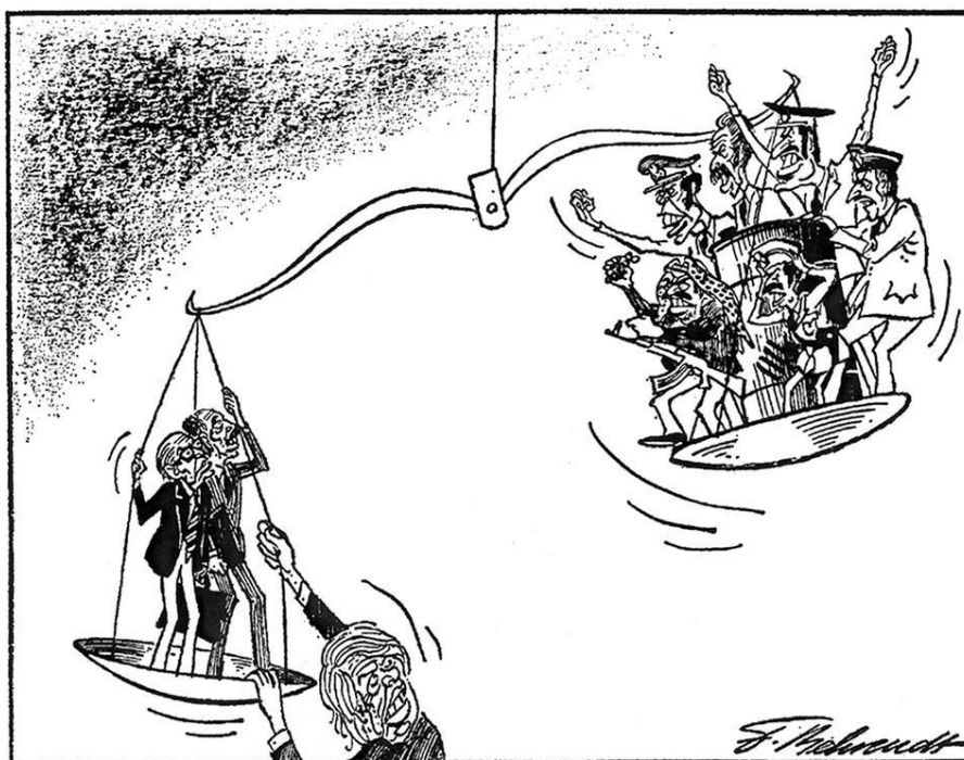
Caricature de Behrendt parue le 28 Septembre 1978 11