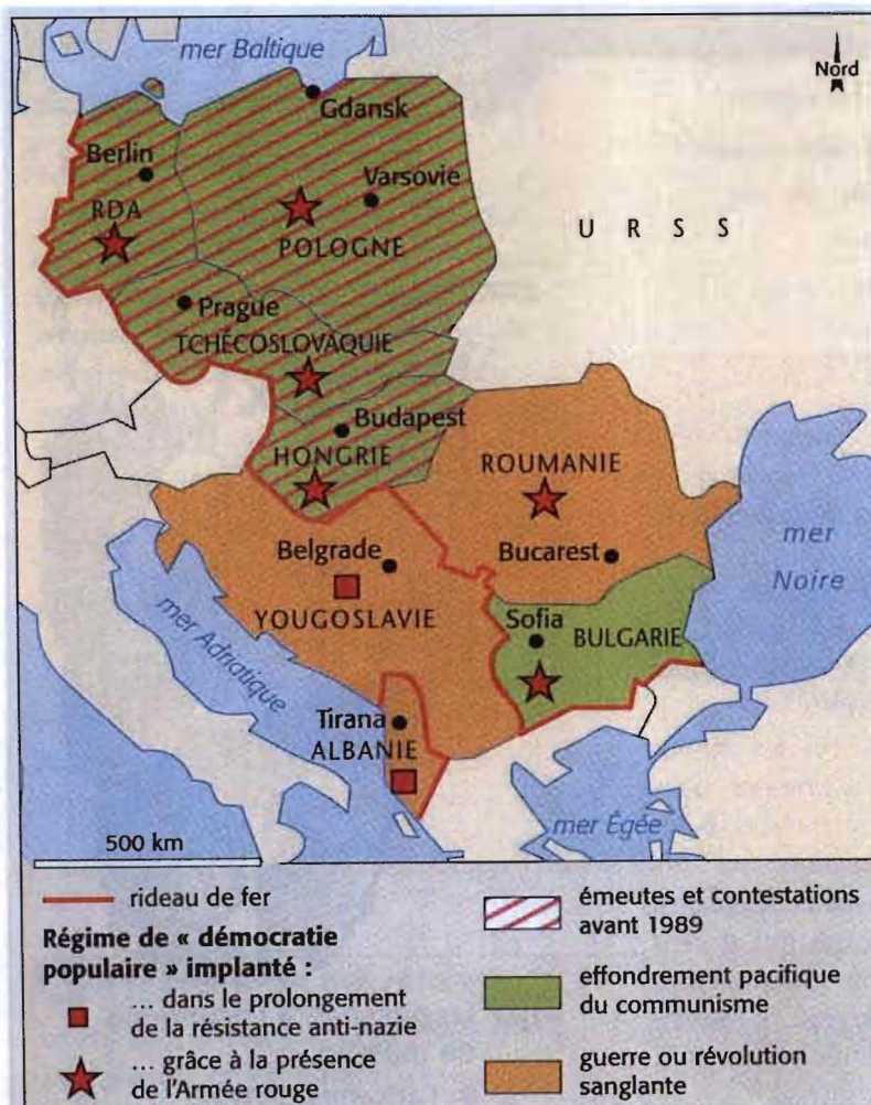
La fin des « démocraties populaires » carte tirée de J.-M. Lambin, Histoire T les ES/L/S , Hachette, 2008, p. 243.