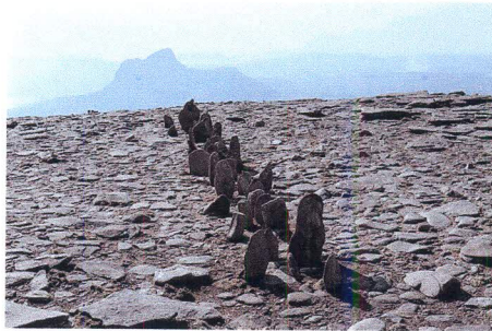
A line in Scotland, 1981

Erläutern Sie diese Aussage indem Sie sich auf Richard Longs Arbeit beziehen.