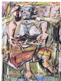
Woman I, 1950-52