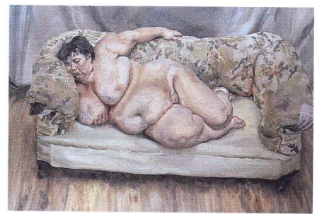
Benefits Supervisor Sleeping, 1995