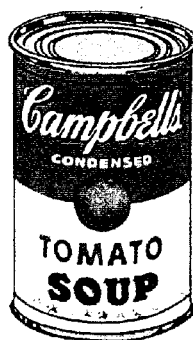
Andy Warhol: Campbell's Soup Can, 1962, Siebdruck auf Leinwand, 51 x 40,5 cm