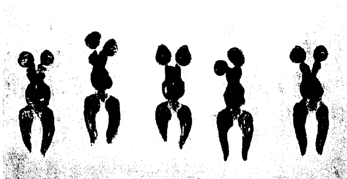
Anthropométrie de l'époque bleue (Ant 82), 1960