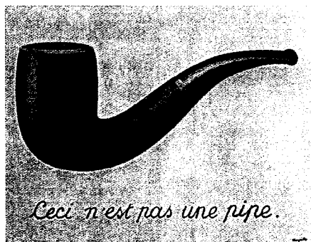
René Magritte: La trahison des images (Der Verrat der Bilder), 1928/29, Öl auf Leinwand, 60 x 94 cm