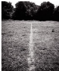
Richard Long , „A Line Made by Walking“ 1967