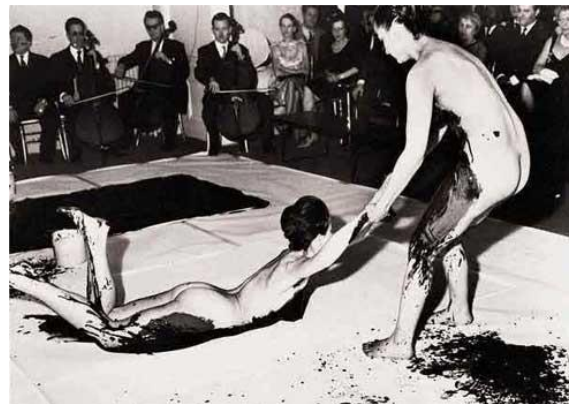
Yves Klein , Anthropometry Performance, 1960

Indem Sie den kunsthistorischen Kontext von Yves Kleins Arbeiten erläutern, nehmen Sie Bezug zu dieser Aussage.