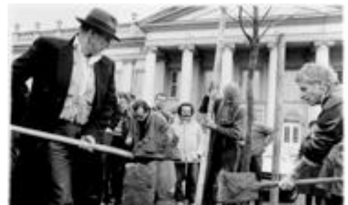
Joseph Beuys , “7000 Eichen, Stadtverwaltung statt Stadtverwaltung“, 1982