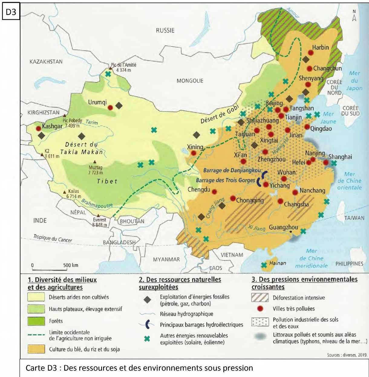
Carte D3 : Des ressources et des environnements sous pression

Répondez aux questions relatives à la carte D3.