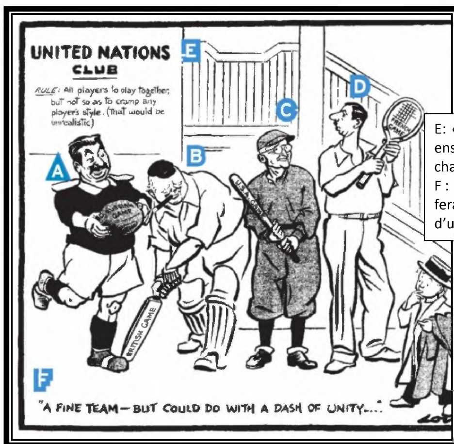
Document 1 : « L'entente difficile entre les vainqueurs », dessin de David, Evening Standard, juin 1945