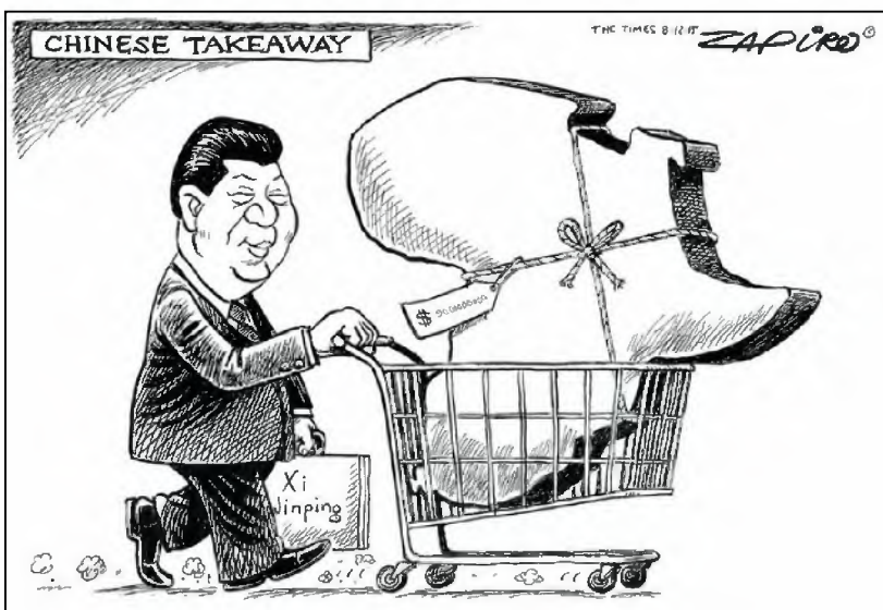
Document 4: « Chinese Takeaway », Zapiro in Times, 2015, Belin Éducation/Humensis, 2019

IV.1. Localisez et décrivez à l'aide du document 3 la présence chinoise en Afrique. 6 p