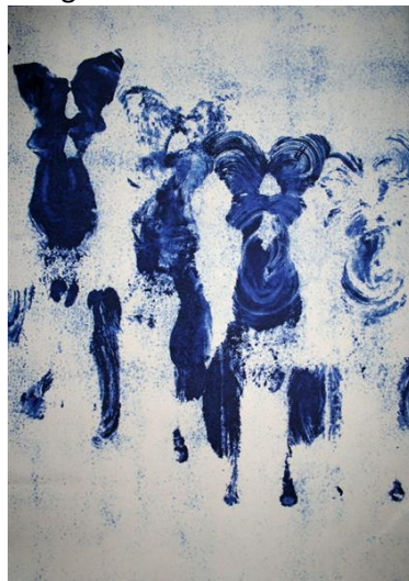
Yves Klein ANT 123 , 1961