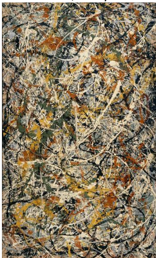
Jackson Pollock Number 3 , 1949

Beschreiben, analysieren und vergleichen Sie diese drei Werke. Nehmen Sie Bezug zur Aussage.