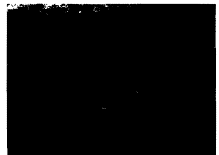
Anselm Kiefer Nürnberg 1982 Acrylfarbe und Stroh auf Leinwand 280 x 380 cm