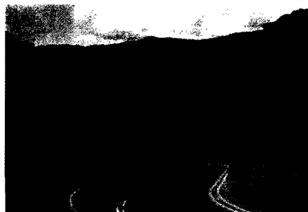
Christo und Jeanne-Claude Valley Curtain , Rifle, Colorado, 1970-72