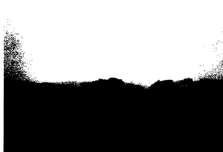
Gerhard Richter, Troisdorf 1985 Öl auf Leinwand 85 cm x 120 cm

Die Landschaft als Vorwand: vergleichen Sie die hier gezeigten Werke und die Absicht des jeweiligen Künstlers.