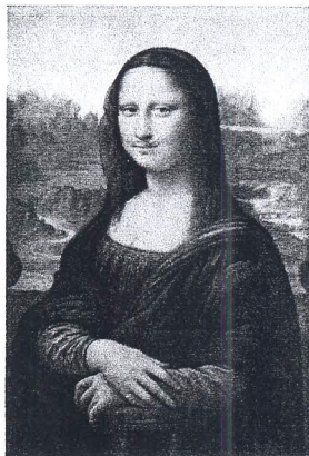
Marcel Duchamp, L.H.O.O.Q. , 1919