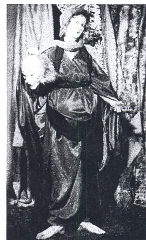
Cindy Sherman, Untitled N°228 , 1990