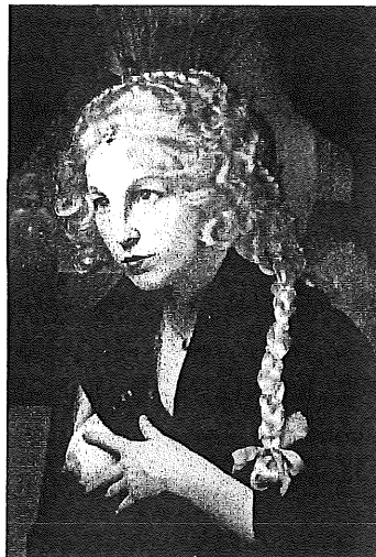
Cindy Sherman, Ohne Titel No 225 . Série: Histoire des portraits (1988-1990)