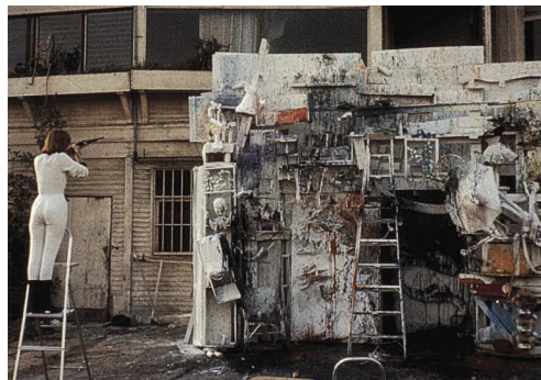
Niki de ST.PHALLE während einer Schießaktion, Despardes, Xdu de Erweit Ellin Gallery, 1962