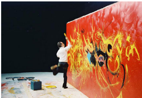
Georges MATHIEU beim Malen (aus dem 'RNXPHQWDU ; OP 30DWKLHX' 1974 von Frédéric Rossif)

Erklären Sie inwiefern die Bezeichnung Malerei als Ereignis auf diese drei Künstler und ihr Werk zutrifft. Gehen Sie auf die jeweiligen Kunstrichtungen und Vorgehensweisen der Künstler ein.