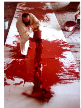
Hermann NITSCH: Schüttbild II, um 1960